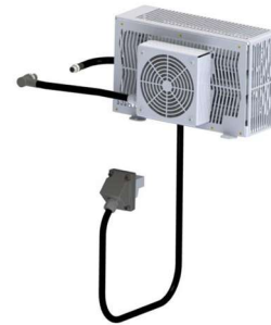
Pulse carrying capacity, brake resistor

Bremswiderstand steckbar auf G110D Steckbar auf Siemens Frequenzumrichter G110D FSA B Konsolenmontage oberhalb des FU Drahtwiderstand 80 Ohm Nennleistung: 1200W (bei 35% ED, T_u = 20^\circ\text{C} : 3000W) Thermoschalter als Überlastsicherung Thermoschalter für Lüfterzuschaltung Lüfter 24 VDC; 5W Silikonfrei Schutzschlauch PA sw Schutzart: IP54 Verwendbar für MLFB: 6SL3511-OPE23-OAMO 6SL3511-IPE23-OAMO