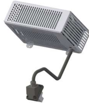
Pulse carrying capacity, brake resistor